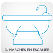
3. MARCHES EN ESCALIER