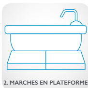
2. MARCHES EN PLATEFORME