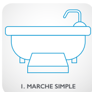
1. MARCHE SIMPLE

Des modules supplémentaires sont disponibles séparément à la vente.