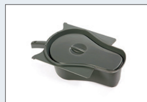
Réf. : 56-209 Bassin avec couvercle