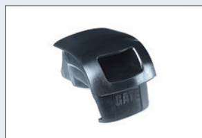
Réf. : 56-232 Bouchon pour siège souple (56-206)