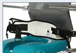
Réf. : 56-217 Ceinture