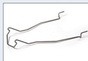
Réf. : 56-218 Support bassin