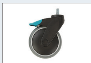
Réf. : 56-361 Roue avec frein Diamètre : 125 mm