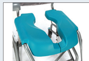
Réf. : 56-234 Assise souple en PU en 2 parties