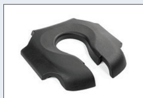
Réf. : 56-206 Coussin confort